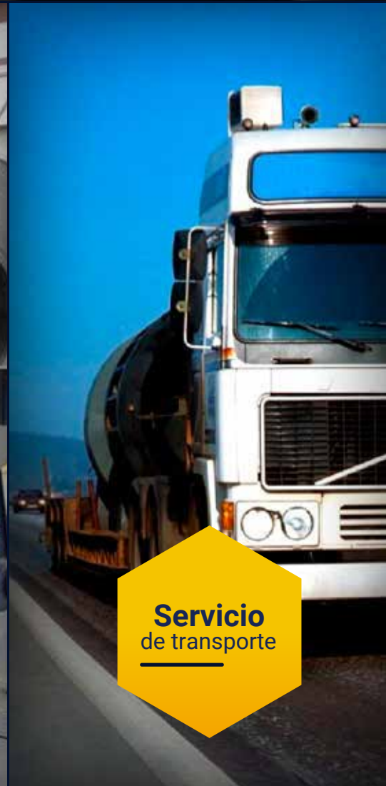
Servicio de transporte