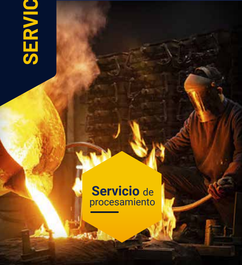
Servicio de procesamiento