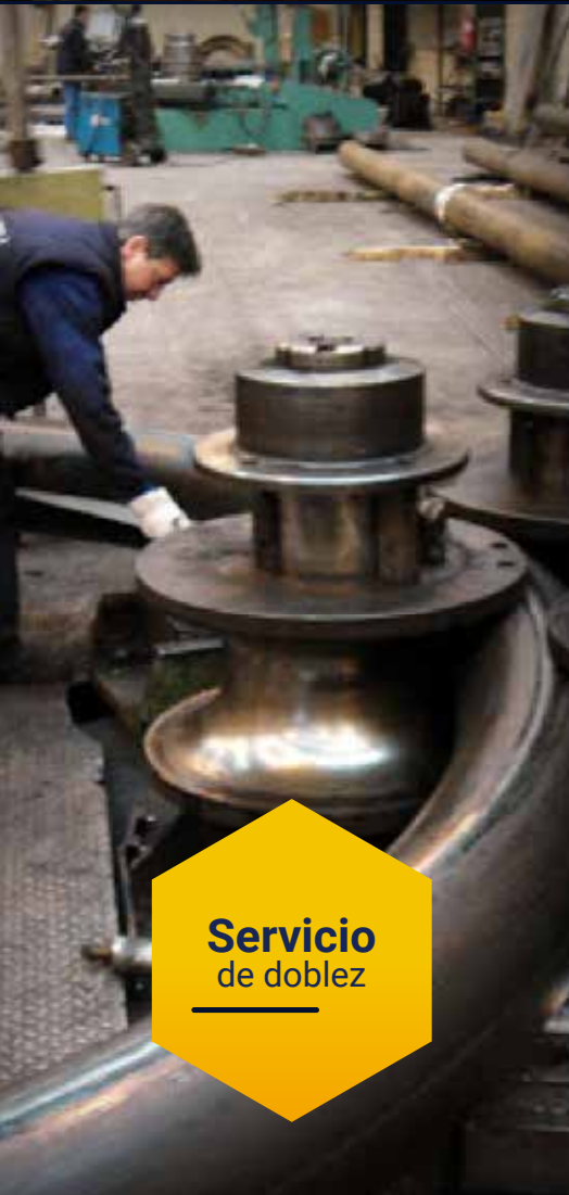
Servicio de dobléz