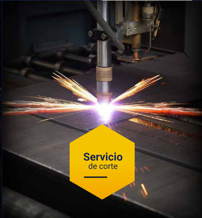
Servicio de corte