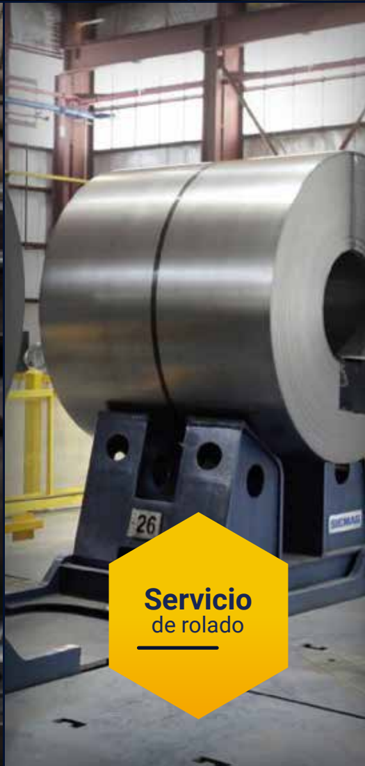
Servicio de rolado